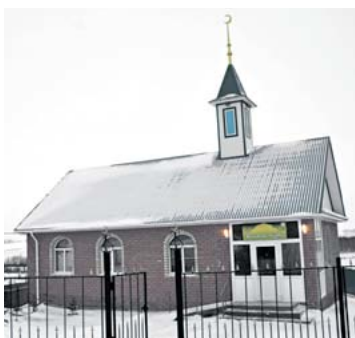
Сүлте авыл мәчете